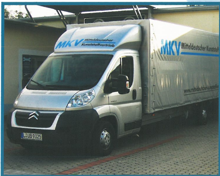
Mit eigenem LKW für Sie unterwegs

MKV - Mitteldeutscher-Kunststoffvertrieb Lilienthalstraße 12 04420 Markranstädt